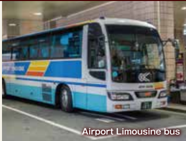
Airport Limousine bus

Umeda Sky Building is about 10minutes' walk UNIVERSAL STUDIOS JAPAN is about 10minutes' by JR railway Namba, Shinsaibashi area is about 5～10minutes' by Subway