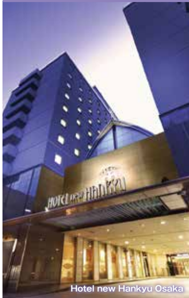
Hotel new Hankyu Osaka