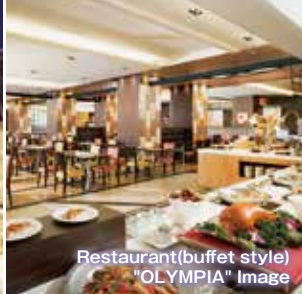
Restaurant(buffet style) "OLYMPIA" Image