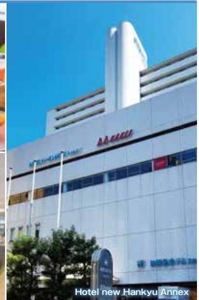
Hotel new Hankyu Annex