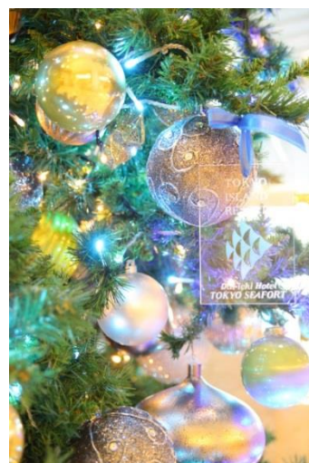
＜ロビーのメインツリー＞

【ご予約/お問い合わせ】TEL 03-5460-4411 (宿泊直通) ※写真はイメージです