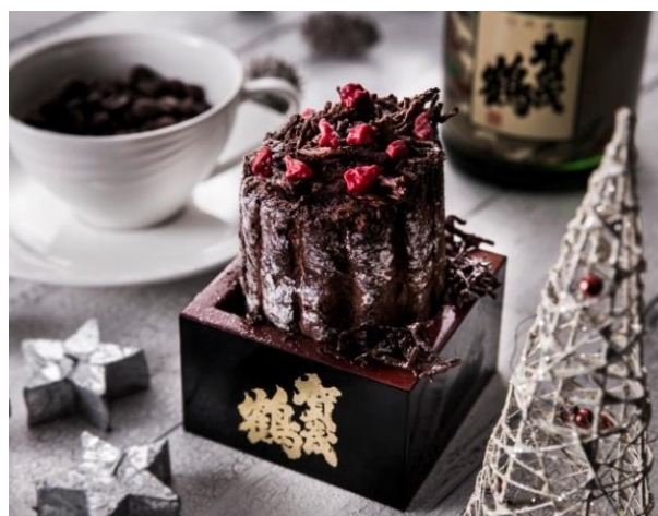
② ショコラロール ～Noir～