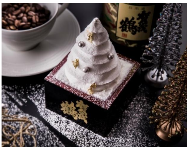
① ホワイトツリー ～Blanc～

クリスマスをイメージした2種類のケーキを漆塗りされた酒枡に入れました。どちらも「賀茂鶴」の純米吟醸酒を風味付けとして使っており、ほんのりと日本酒がお口の中に広がります。