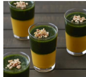
＜おいしさと栄養を凝縮＞ かぼちゃのパバロアと グリーンスムージー 【ディナー限定】