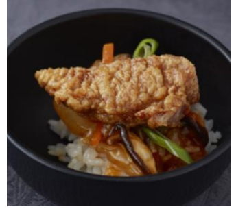
＜酸っぱい×辛いがやみつきに＞ さんらんあん 酸辣餡かけパイコー井