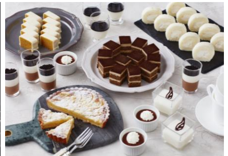
スイーツのテーマは 「白×黒の世界」