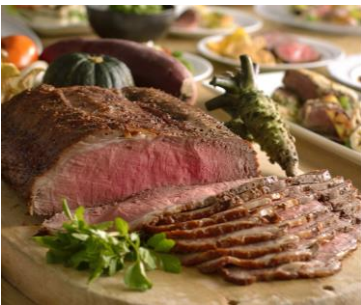
＜当店看板メニュー＞ ローストビーフ サルサメヒカーナ