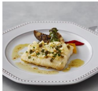
＜上品に仕上げたフランス料理＞ 白身魚のソテー グルノーブル風