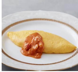
＜1つつ焼きたてを楽しめる＞ ふわとろオムレツ 蟹入りトマトクリームソース 【ランチ限定】