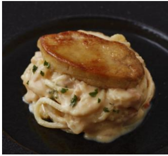
＜フォアグラ×パスタの新作＞ フォアグラの和風カルボナーラ 柚子胡椒風味