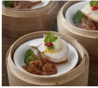
＜中華スープで炊くブリ大根＞ 中華風蒸しブリ大根 ふかひれ餡かけ 【ディナー限定】