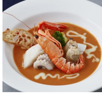
＜魚介類の濃厚スープ×チーズ＞ ラングスティヌと 海の幸のビスク仕立て 【ディナー限定】