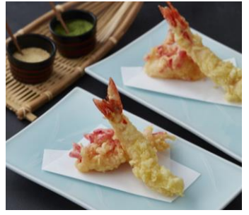
＜冬の食材、鱈を味わう＞ 揚げたての鱈と海老の天ぷら 変わり塩で