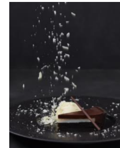
＜ホワイトチョコが舞う＞ ブラックタルト アイスと一緒に 舞い降りる ホワイトチョコをかけて 【ディナー限定】