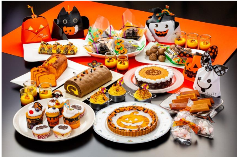
ハロウィンフェア(スイーツ)