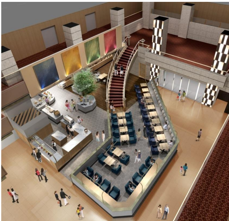
シングルシートカウンター席

また、ビジネスなどでもご利用いただけるよう、充電コンセントやUSBポートも完備いたしました。