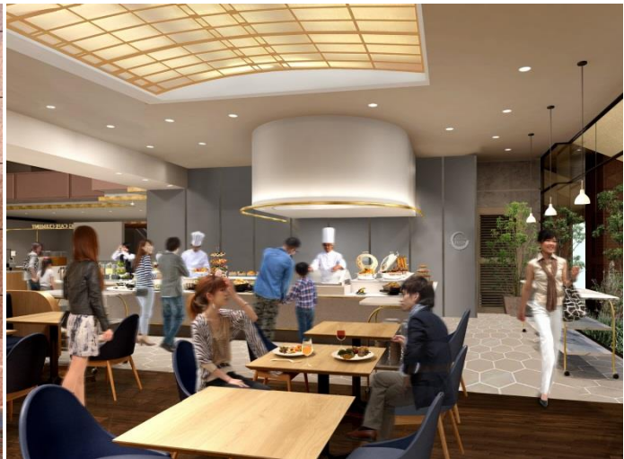
拡充したライブキッチンで出来立ての料理を提供