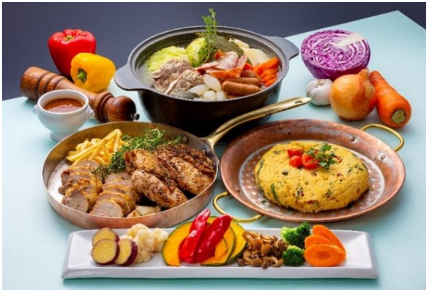
ランチビュッフェ(ふわふわオムレツ・ほっこりポトフなど)

ライブキッチンの拡充により、シェフの鉄板パフォーマンスなどより間近で見ることができ、出来立て熱々のお料理をお召し上がりいただけます。