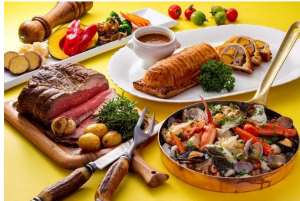
ディナービュッフェ(ローストビーフ・アクアパッツァなど)