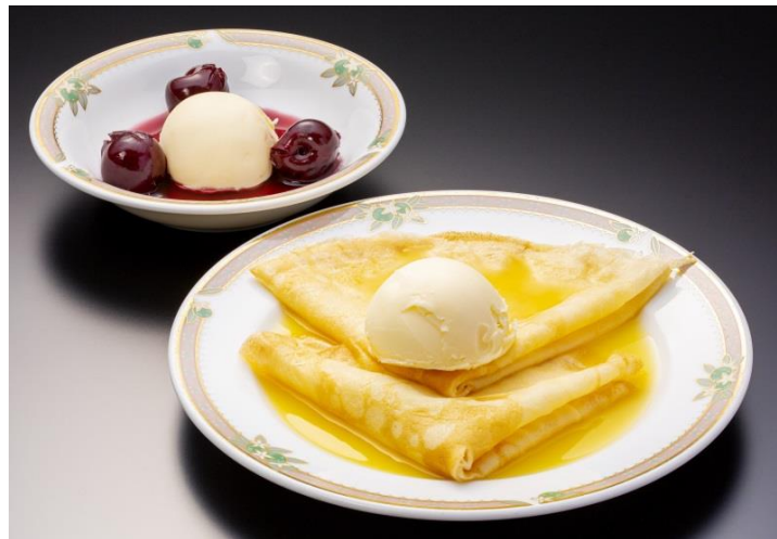
クレープシュゼットとチェリージュビレ(※ディナータイム限定)