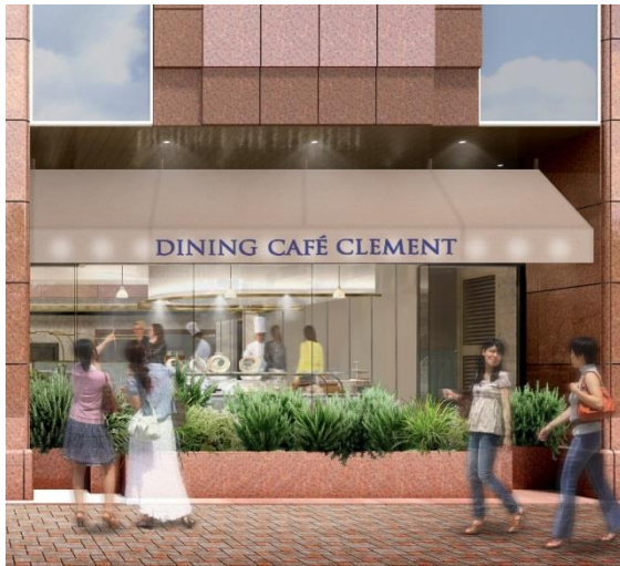
外部に新設したオーニングにより視認性を向上

今回のリニューアルは「魅せるホテルビュッフェ」をコンセプトに、SNS映えするスイーツが並ぶ“シンボルツリー”、躍動感のあるライブキッチン、さらにスイーツのフランベ演出などエンターテインメント性を高め、お客様の満足度向上を図ります。また、外観についても、オーニング※の新設と植栽の整備により、外部からの視認性を高め、店舗の持つ魅力を発信いたします。(※日よけ・雨よけのテント)