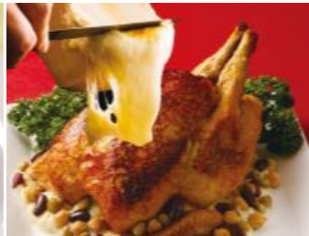
ローストチキン ラクレットチーズのせ