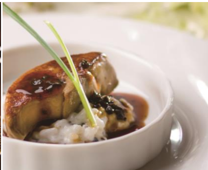
フォアグラとトリュフの香るリゾット