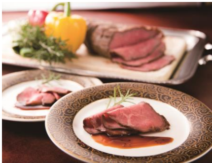
牛ロース肉のローストビーフ ジャーマンポテト添え