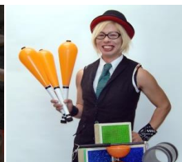
ジャグリングショー