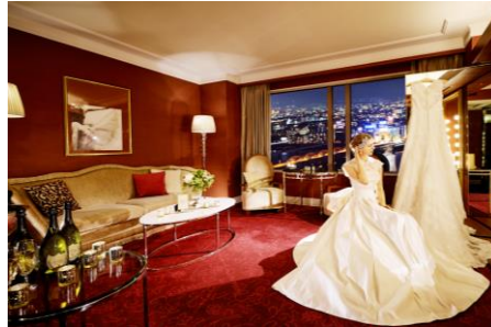
スイートルームをお支度部屋として使用