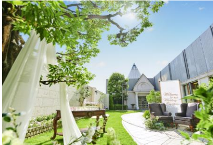
ホテル内ガーデンでの挙式も選べる

ホテル阪急インターナショナル(大阪市北区茶屋町19番19号 総支配人:菅野 伸一)では、2019年12月12日(木)より、結婚式の思い出づくりにスポットをあて、両親や家族になかなか伝えられない“ありがとう”の気持ちを表す8つのシーンに合わせたコンテンツをセットにした滞在型ウェディングプランを販売いたします。当ホテルのウェディングは、スイートルームに宿泊いただき、そのままブライズルームとしてお支度いただくプランが自慢の1つ。永遠に家族の絆を結ぶよう、インフィニティ(永遠)の記号「∞」にちなみ、8つの思い出づくりシーンを提案いたします。