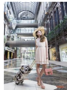
シンボリックな空間である「ガレリア」での挙式も可能

※表記の料金にはいずれも消費税・サービス料10%が含まれます。※画像は全てイメージです。