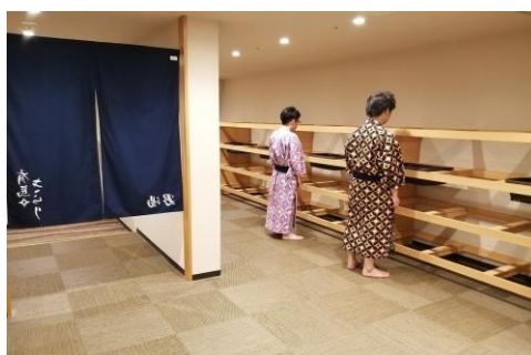
ホテル大浴場定員入場制限は5名に