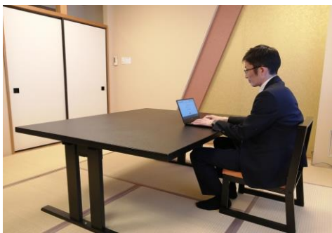
執務用デスク客室ワークションイメージ