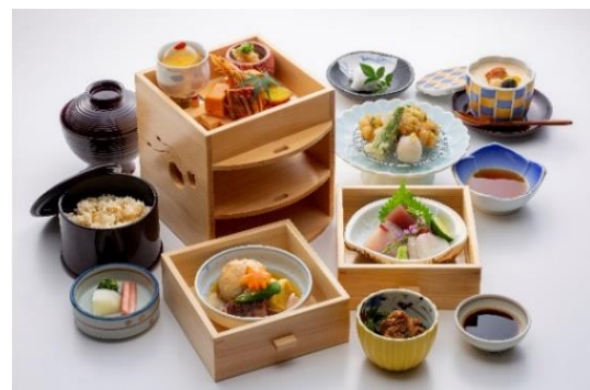
日本料理 藍彩「藍彩遊山箱」

※表記の料金にはいずれも消費税・サービス料が含まれます。※画像は全てイメージです。