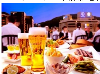
ソーシャルディスタンスを確保したレイアウト

※7/1～7/7は開業記念ウィークとして、さらにお得な1名様4,900円となります。