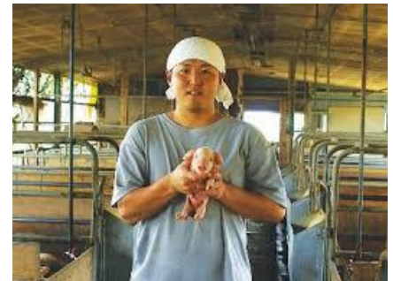
「阿波の金時豚」生産 有限会社 NOUDA