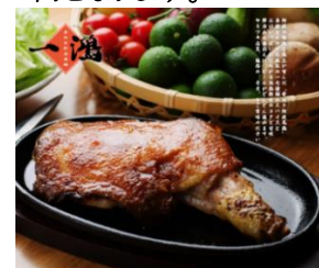
居酒屋「一鴻」の骨付き阿波尾鶏

JRホテルクレメント徳島では、新型コロナウイルスの感染予防対策を講じています。 https://www.jrclement.co.jp/tokushima/info/20200305_2/