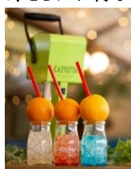
オプションメニュー「カジュッタ」