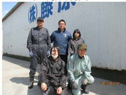
「阿波牛」生産 株式会社藤原ファーム