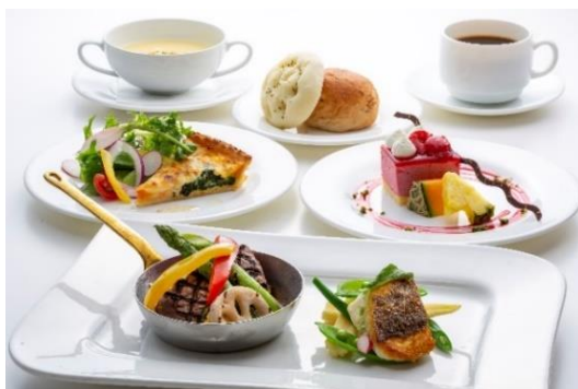
ダイニングカフェクレメント「シェフのおすすめプレート」

※7/1～7/7は開業記念ウィークとして、さらにお得な1名様(夕朝食付き)4,650円となります。