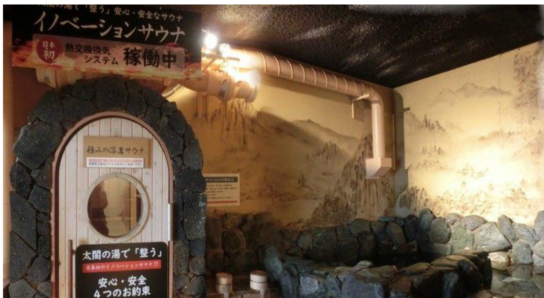
熱波対流イノベーションサウナ

これまで、当社では、閉鎖空間であるサウナの安全対策として、ウイルス不活性化のための高温化（90℃以上）、サウナ室を空気触媒抗ウイルスコーティング（※3）の実施、10分毎の抗ウイルスアロマ（※4）でのオートローリュ（※5）、飛沫防止ソロボース（※6）の導入等、関西温浴施設では先進的となるコロナ対策を種々講じて参りましたが、エアロゾル化による感染力が高いと言われる変異型コロナウイルスの予防には換気強化が有効的と言われているため、コロナ禍での安全安心なサウナ室を実現するために、サウナ室の高温を維持しながら強制換気でき、熱波対流を起こすシステムの調査・開発を三社共同で進めてまいりました。これからも、サウナにイノベーションを起こし、安全安心に利用していただける温浴施設を目指し、引き続き快適なサウナ環境を追求してまいります。