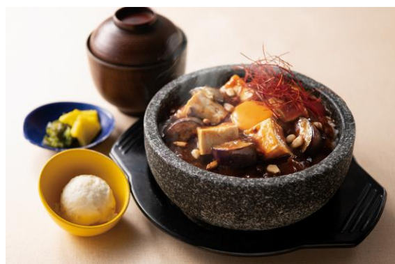
石焼麻辣豆腐丼 1,210円