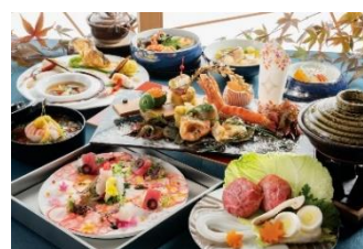
ご夕食 イメージ（12月）