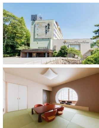
上) 有馬きらり 下) いろは館 客室例