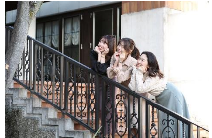
クリスタルチャペル前