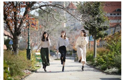
ホテル前「花のみち」