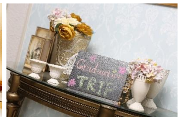
メッセージボード