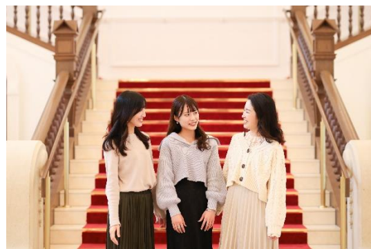
宝塚ホテル ロビー大階段