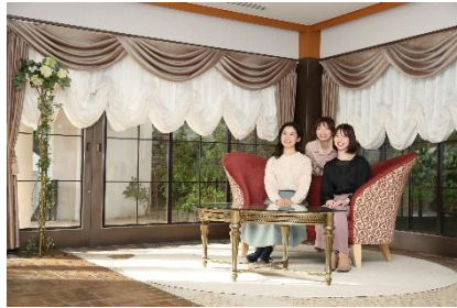
宴会場前スペース