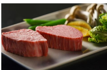
神戸牛の鉄板焼コース