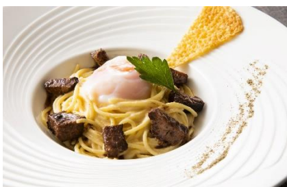
牛タンカルボナーラ