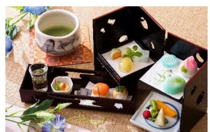
和風アフタヌーンティーセット