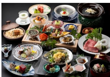
ご夕食会席イメージ