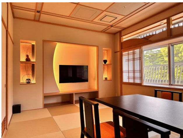
和の趣あふれるモダンな新客室「鼓」室内

新客室は当館初となる源泉かけ流しの「銀泉」を導入したビューバスを付設し、四季折々の有馬の風景を眺めながら肩湯やジェットバスをお楽しみいただけます。「エアウィーヴ」の寝具のほか、ドリップコーヒーマシンや、有馬温泉の伝統工芸品である「有馬筆」・「有馬籠」のアートワークも配置するなど、快適にお過ごしいただける空間を提供します。