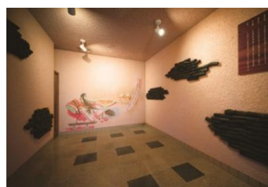
個室岩盤浴でゆったり発汗