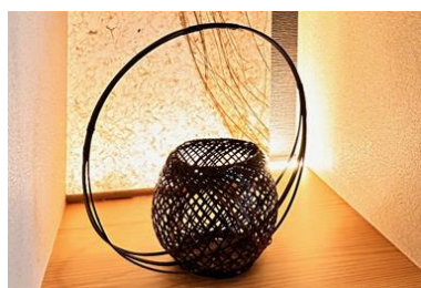
伝統工芸品「有馬籠」