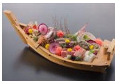
ご夕食は豪華な舟盛り付き