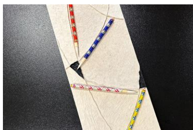
「有馬筆」をあしらったタペストリー