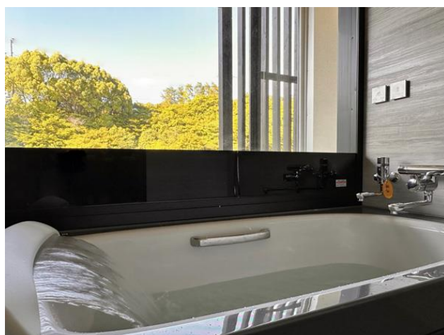
「銀泉」と景色を楽しめる肩湯機能付きビューバス