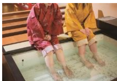
ドクターフィッシュ体験も