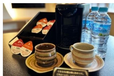
客室内にドリップコーヒーマシンも完備