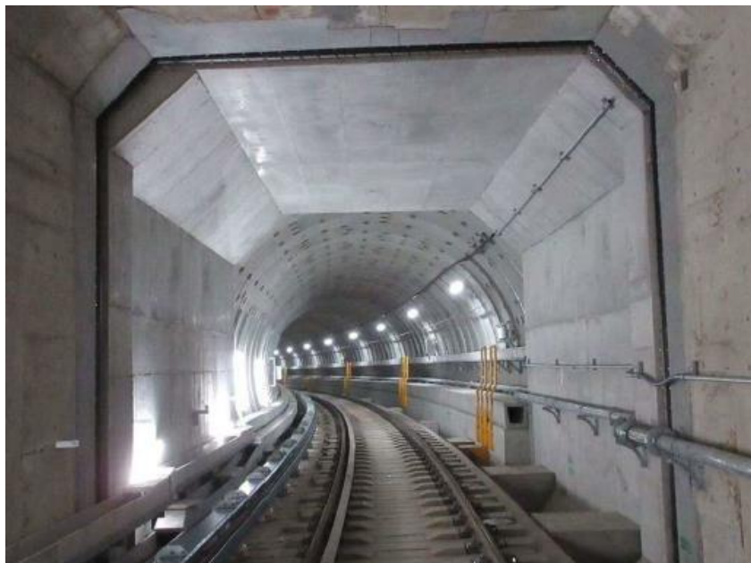
トンネル接続部へは、終電後の線路を歩いて向かいます。

北大阪急行電鉄は1970年に開催された大阪万博会場への鉄道輸送手段として、同年2月24日に開業しました。それから55年の歳月を経て、本年4月には「EXP02025 大阪・関西万博」が開催されます。55年前に造られたトンネルと、延伸により新しく造られたトンネルとの接続部を歩きながら、大阪で開催されたこの二つの「万博」にも思いを馳せていただきたいと思います。