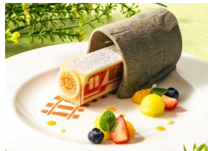
特別デザートプレート（ランチ時提供）