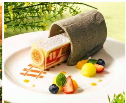
特別デザートプレート(ランチ時提供)