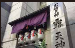
お初天神(露天神社) 徒歩約1分