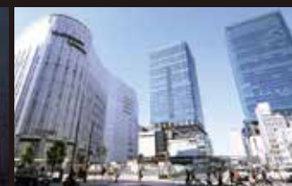
ヨドバシカメラ・グランフロント大阪 徒歩約7分