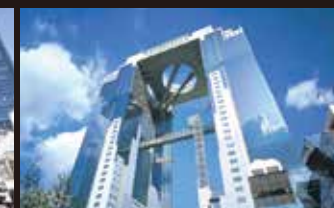
梅田スカイビル 徒歩約17分