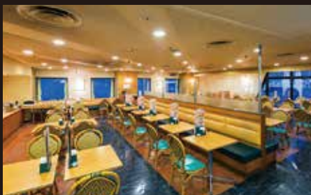
イタリアンワイン&カフェレストラン