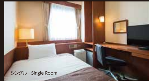
シングル Single Room