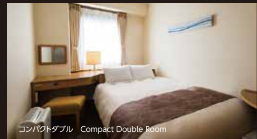
コンパクトダブル Compact Double Room