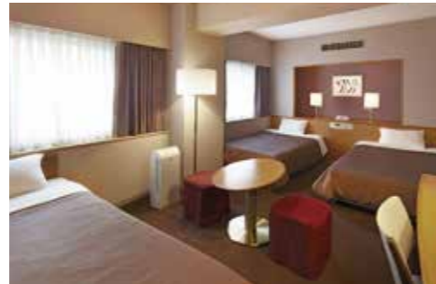
トリプルルーム Triple Room