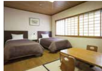
和洋室 Japanese Western Style Room