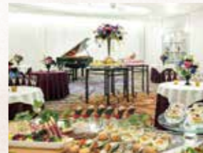
星・月の間 Hoshi, Tsuki Hall