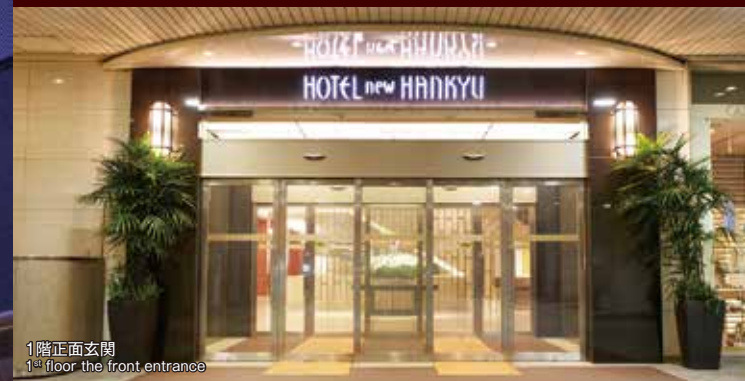
1階正面玄関 1 st floor the front entrance

Our hotel has great access to the JR Osaka Station, Hankyu, and Umeda subway station. We have limousine buses arriving and departing from our front doors which are very convenient to get to Kansai International Airport and Osaka Airport(Itami).