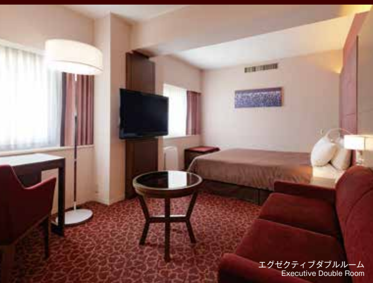
エグゼクティブダブルルーム Executive Double Room