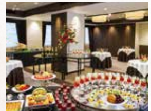
宙の間 Sora Hall