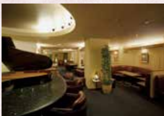
パブ・ラウンジ「ビーツ」 Pub Lounge "Beets"