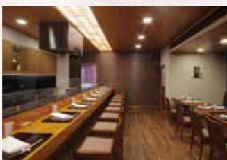
日本料理・天ぷら「なにわ橋」 Japanese Cuisine Tempura "NANIWA TACHIBANA"