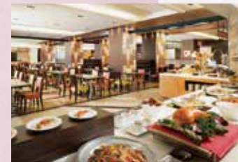
グルメバイキング「オリンピア」 Buffet Style Restaurant "OLYMPIA"

関西最大級の バイキングレストランをはじめ ステーキハウス フレンチ&チャイニーズ 日本料理など 多彩なレストラン&バー。 シェフが腕によりをかけた 美味の数々で おもてなしいたします。