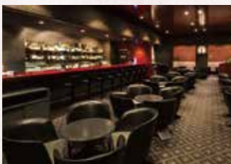
バー「リード」 Bar "REED"