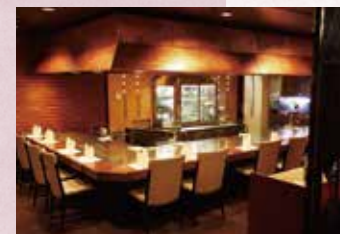
ステーキハウス「ロイン」 Steak House "LOIN"