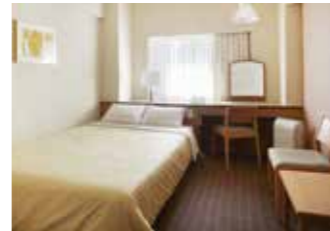
ダブルルーム Double Room