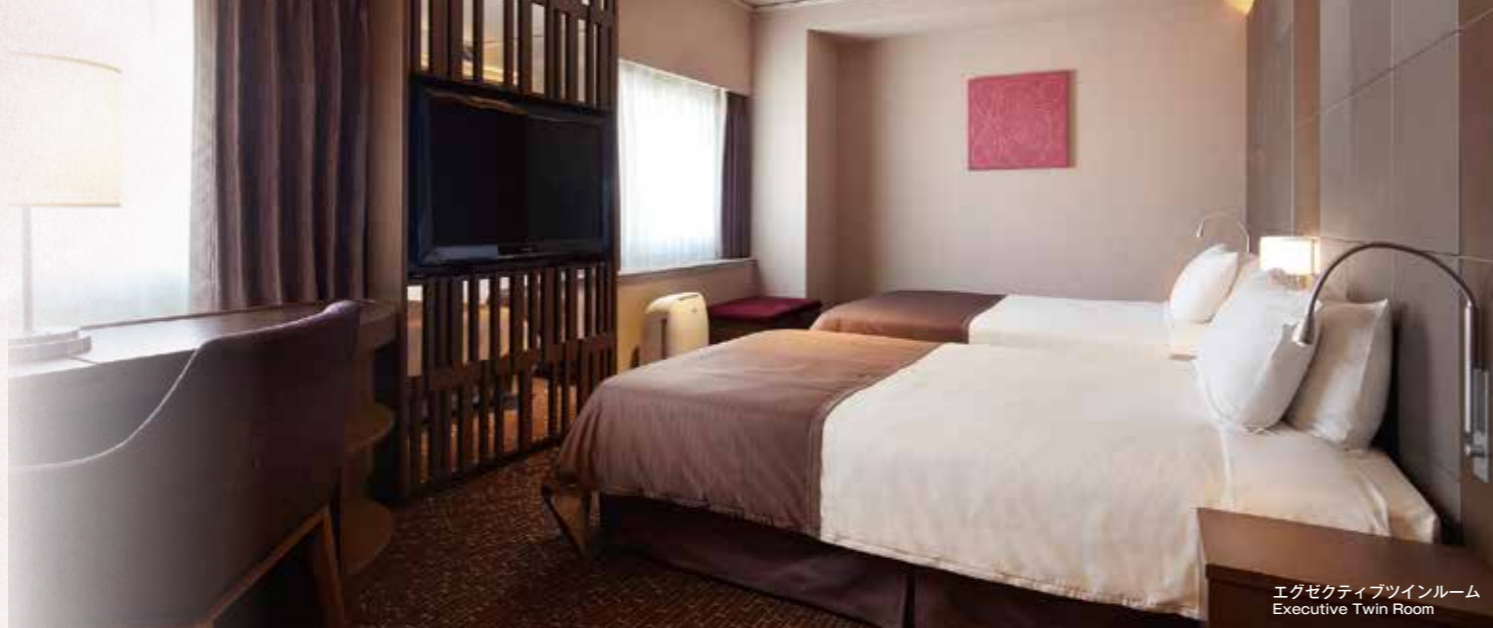
エグゼクティブツインルーム Executive Twin Room