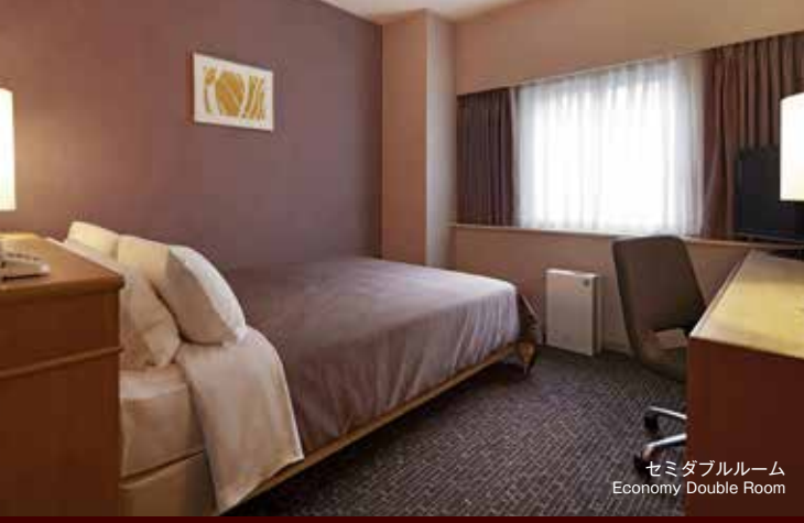
セミダブルルーム Economy Double Room