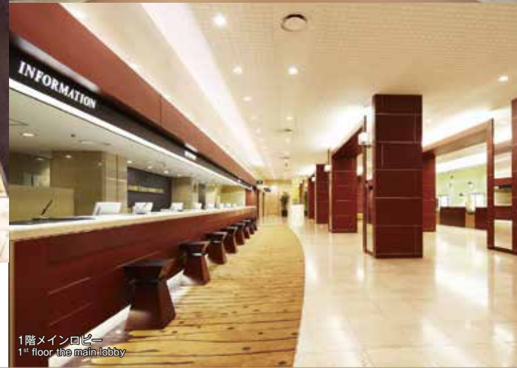
1階メインロビー 1 st floor the main lobby