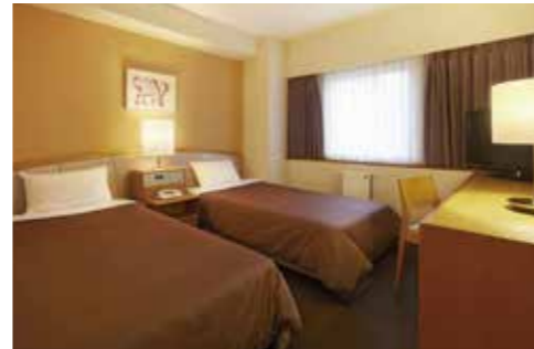
スタンダードツインルーム Standard Twin Room