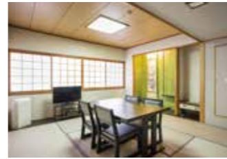
和室 Japanese Style Room