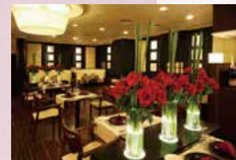
フレンチ&チャイニーズレストラン「モンズレー」 French & Chinese Restaurant "MONSELET"