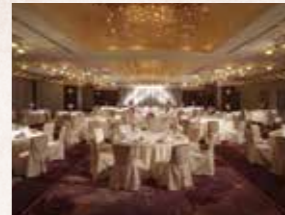
紫の間 Murasaki Hall