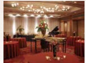
花の間 Hana Hall