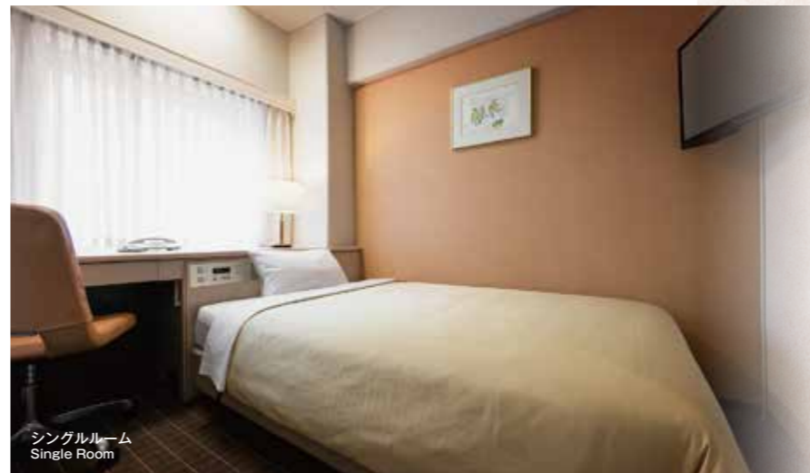
シングルルーム Single Room