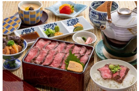
30周年記念特別ランチ

<内容> ひつまぶしならぬ「にくまぶし」と言えるくらい お肉が敷き詰められた豪華なランチです。