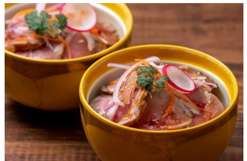
ローストビーフ丼