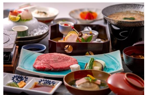
30周年記念特別会席

<内容> 徳島の地産地消食材を使用した調理長自慢の 豪華な会席をご用意。会席には、ホテルのロゴが 入った藍染めのハンカチが付きます。