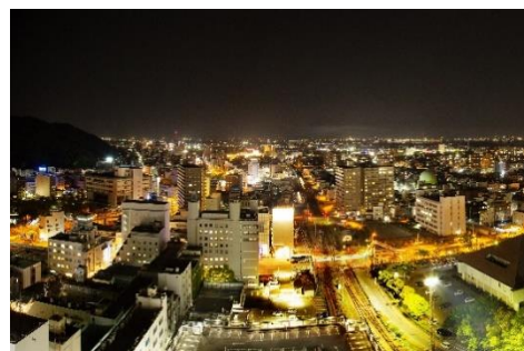
高層階からの夜景

＜プラン内容＞ 13階以上の客室を確約。一般料金より30%OFFにてご宿泊いただけます。高層階からの景観や夜景をお楽しみください。1日10室限定です。