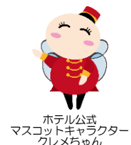
ホテル公式 マスコットキャラクター クレメちゃん