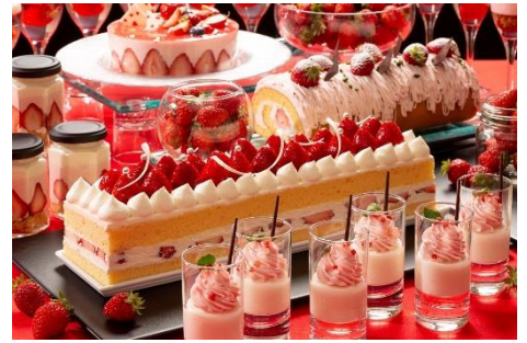
3・4月限定 あまおう苺のスイーツ

<内容> 旬の厳選フルーツをメインに使用したスイーツや こだわりのお食事が食べ放題。