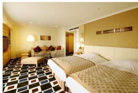
デラックスコーナーツイン

＜プラン内容＞ 開業記念月の7月がお誕生月のお客様限定の宿泊プランです。夕食は日本料理藍彩の会席料理を提供します。