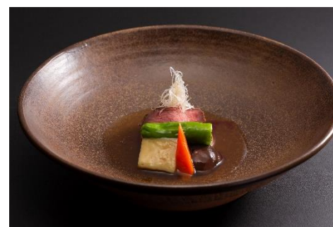
ホテルオリジナルの器（大谷焼）

＜プラン内容＞ 今回の賞味会のために、徳島を代表する歴史ある陶器「大谷焼」の窯元にホテルオリジナルの器を制作していただきました。大谷焼と和洋中調理長の料理とのコラボを愉しんでいただける特別な賞味会です。また、売り上げの一部をNPO法人「徳島子ども食堂ネットワーク」へ寄付いたします。