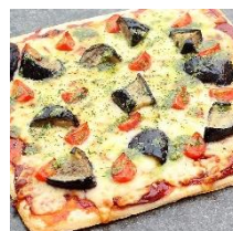
茄子とトマトのピッツァ バジルの香り （5月の土日祝）