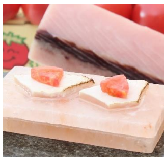
<5月> カジキマグロの岩塩焼き 倉橋産お宝トマト添え

呉阪急ホテル（広島県呉市中央 1-1-1 総支配人 おとあひ ひろゆき 落合 弘幸）バイキング「イルマーレ」では、店内で出来たてのお料理を提供するコーナー「イルマーレ・シェフズキッチン」にて、2018年5月1日（火）より人気の「国産牛ステーキ」に加えて、食材の旨みが引き立つヒマラヤ産「岩塩プレート焼き」を月替わりで提供します。