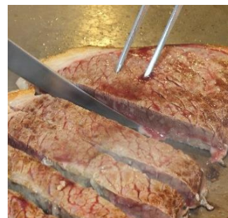
人気の国産牛ステーキ