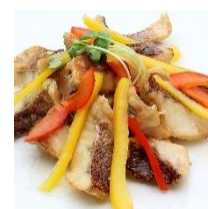
白身魚のフリット イタリアンドレッシング （6月）