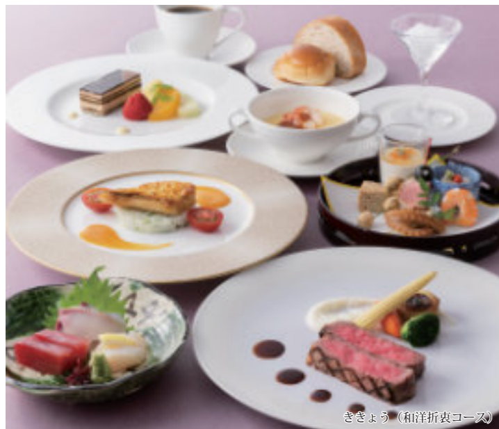
ききょう (和洋折衷コース)

前菜 造り スープ 魚料理 箸休め 肉料理 パンとバター デザート カフェ ※フレンチコースもお選びいただけます。