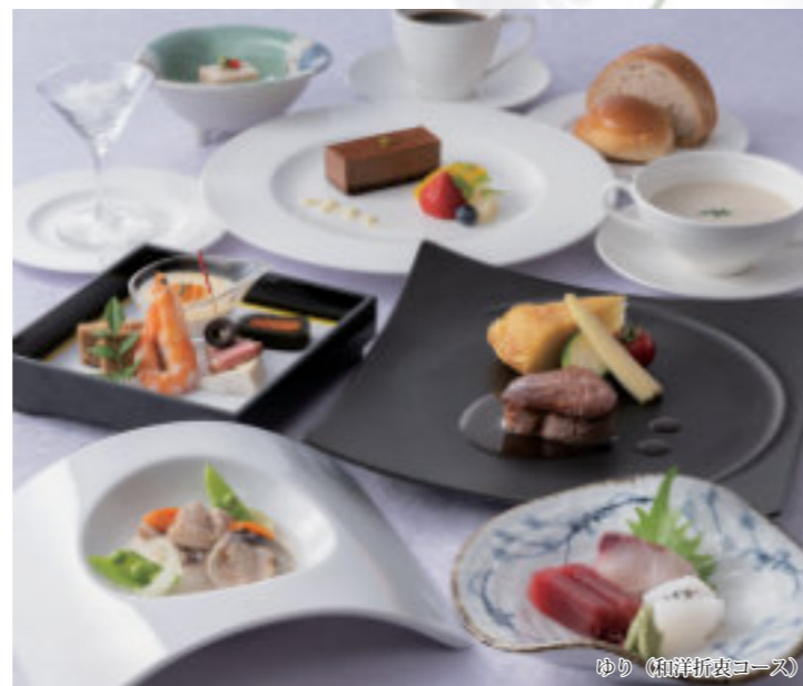
ゆり (和洋折衷コース)

前菜 造り スープ 魚料理 箸休め 肉料理 パンとバター デザート カフェ ※フレンチコースもお選びいただけます。