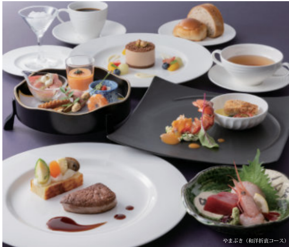
やまぶき (和洋折衷コース)