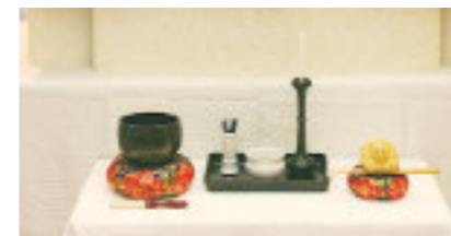
掛け軸・おりん・木魚・線香・ろうそく・焼香