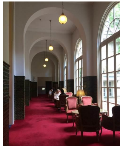
アーチ付き天井の回廊