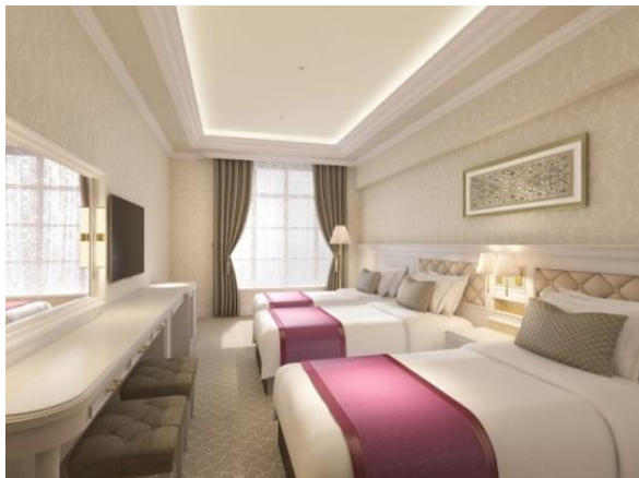
アクセントカラーにピンクを用いた宝塚ホテルを象徴する華やかな客室。