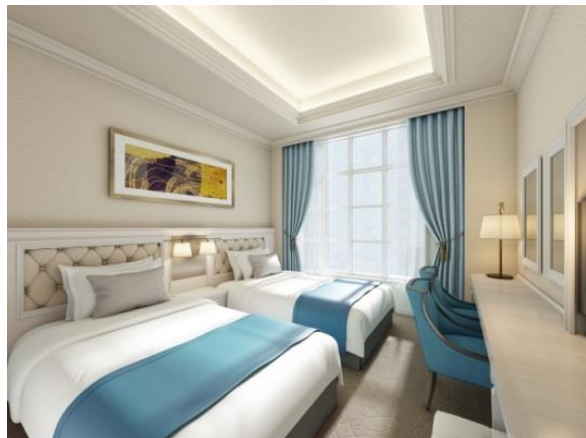
アクセントカラーにブルーを用いた清らかで落ち着いた客室。