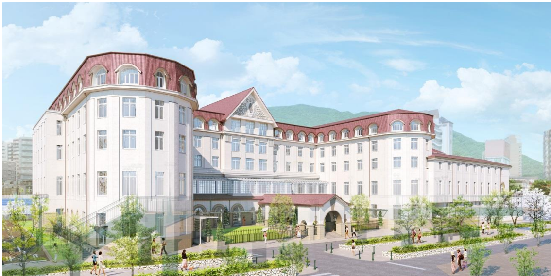
新ホテルの外観イメージ（花のみち側（北側）より）

なお新ホテルの開業に伴い、現在の宝塚ホテルは2020年3月31日（火）のご宿泊利用をもって営業を終了いたします。