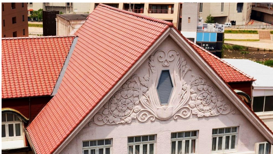
切妻屋根と植物モチーフのレリーフ

切妻屋根の壁面などに描かれている植物モチーフのレリーフや、建物の外壁を特徴づけるドーマー窓と半円形屋根、アーチ付き天井を持つ回廊、階段の手すりに施された装飾などを復元するとともに、現在のホテル館内に飾られている緞帳（どんちょう）や宴会場内のシャンデリアを新ホテルに移設し、今後も宝塚の街のシンボルとしてご愛顧いただけるホテルを目指します。