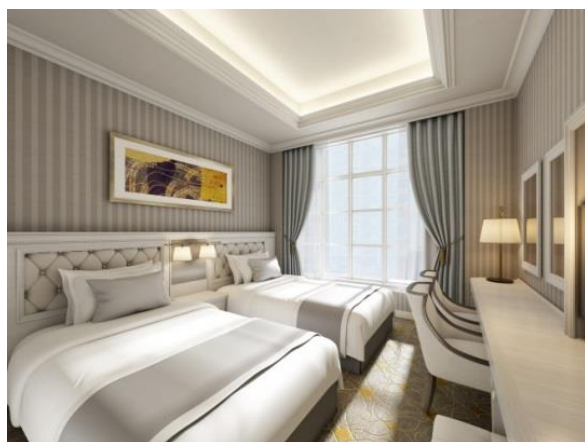
落ち着いた色調のクラシックかつシックな客室。ビジネスユースにも対応。