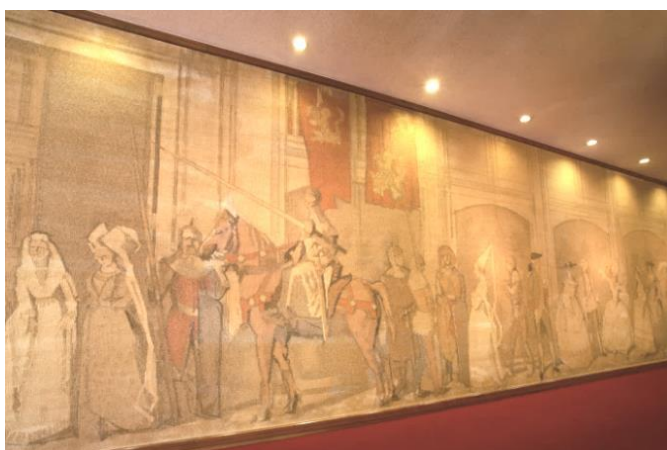
宝塚大劇場で実際に使用されていた緞帳 (1976年1月~1981年5月)