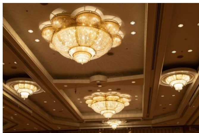
移設するシャンデリア（宝寿の間）