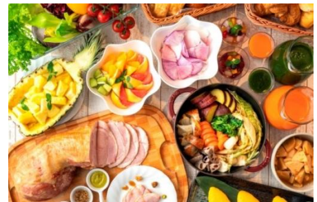
朝食ビュッフェイメージ