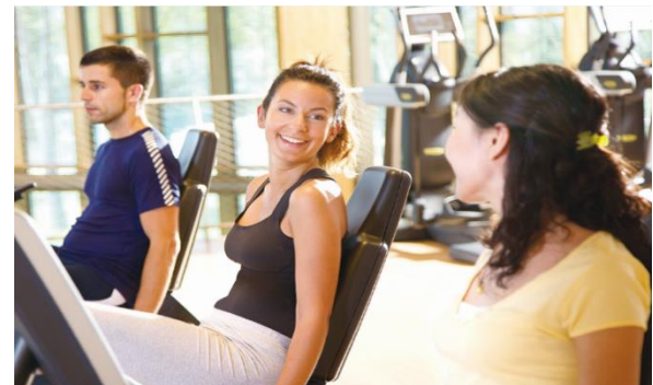
フィットネスイメージ