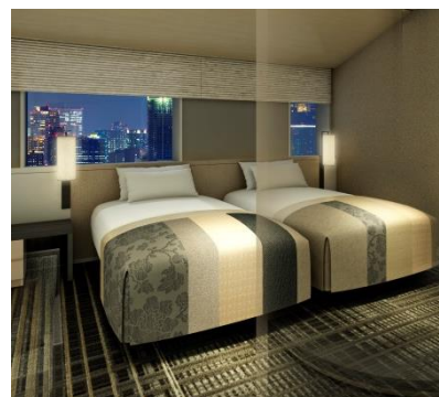
■大阪城 ゴールドを差し色に使用、雅な大阪と城の石垣をイメージ