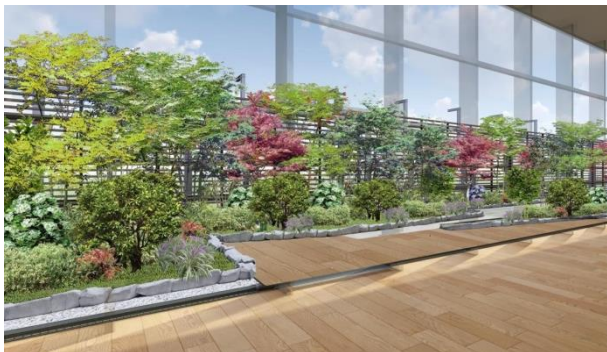
日本庭園イメージ