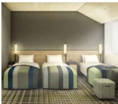
■田園 阪急・阪神沿線の田園風景をイメージ